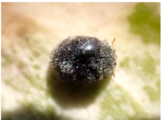
Rhyzobius forestieri