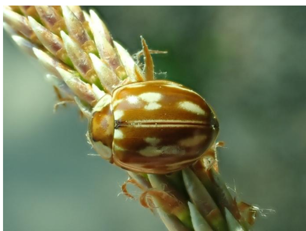
Neomyzia oblongoguttata

This also seems to be the case for the representatives of the Epilachnini tribe, who are totally absent from this study. According to our knowledge, only Subcoccinella vigintiquatuorpunktata (Linnaeus) occasionally exceeds 1500m.