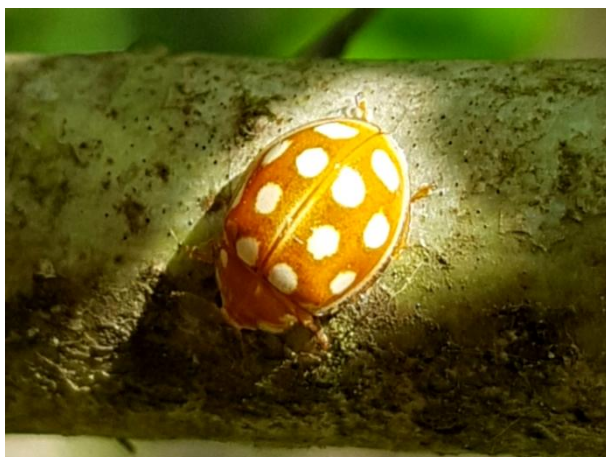
Calvia quindecimguttata

Pour le Grand-Est, même constat en Lorraine avec des données très anciennes, du milieu du 19 ème siècle (Gehin, 1857 ; Bourgeois, 1913). Une donnée plus récente existe en Alsace, Henry Callot (comm. pers.) ayant observé un individu le 14 Juillet 1992 au sol dans des herbes à Brumath (67) dans une forêt mixte au sous-bois assez humide.