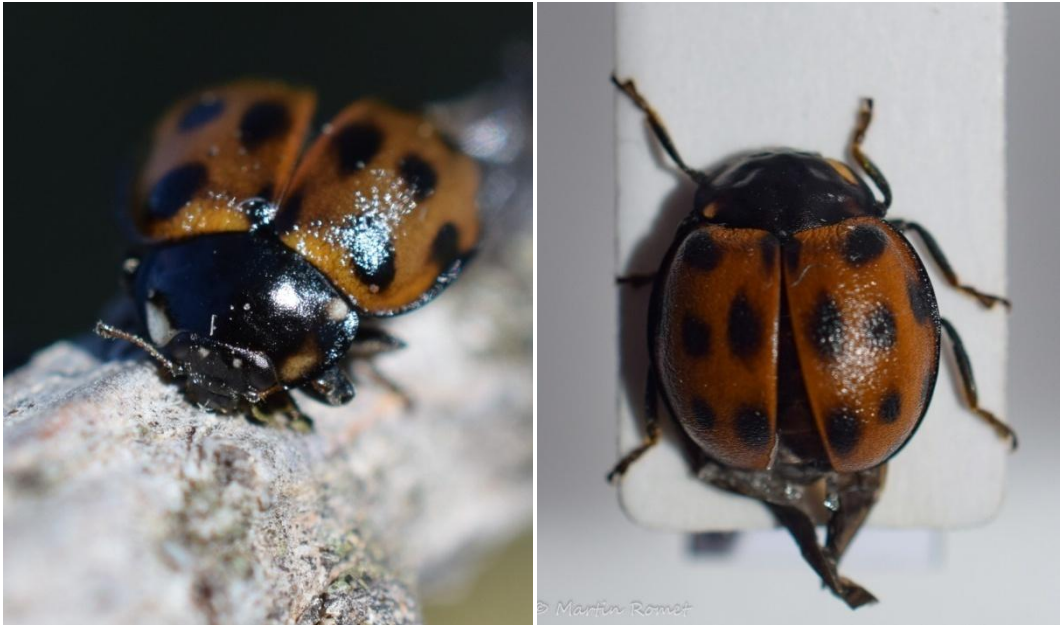
Forme atypique de Anatis ocellata

car la bibliographie fait mention d'une taille variant entre 7,5 et 9 mm pour Anatis ocellata (Iablokoff-Khnzorian, 1982 ; Nedvěd, 2015) : ici il mesure seulement 7 mm. L'ensemble des autres critères correspond bien à cette espèce. La tête est noire et deux macules pâles garnissent le front, les antennes sont testacées avec les massues plus sombres et la face ventrale est noire (Iablokoff-Khnzorian, 1982).