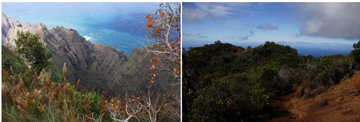
Awa'awapuhi trail, île de Kaua'i