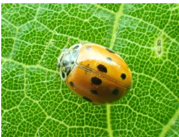
Adalia decempunctata