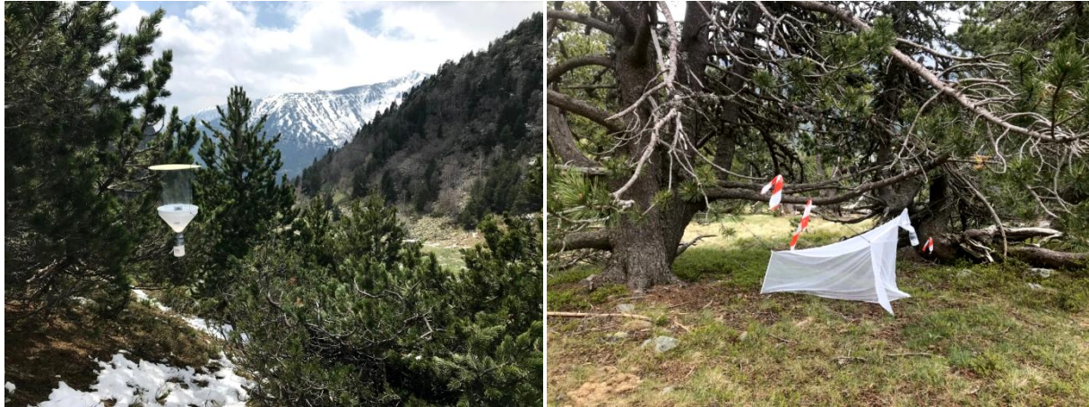
Flight intercept – Rialb, El Serrat / Malaise – Besalí, El Serrat

No additional active prospecting has been carried out.