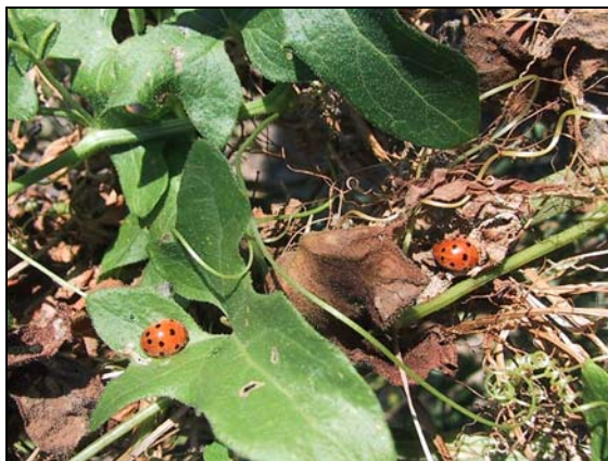
Deux spécimens d' H. argus dans une bryone à demi fanée à la fin de l'été 2009