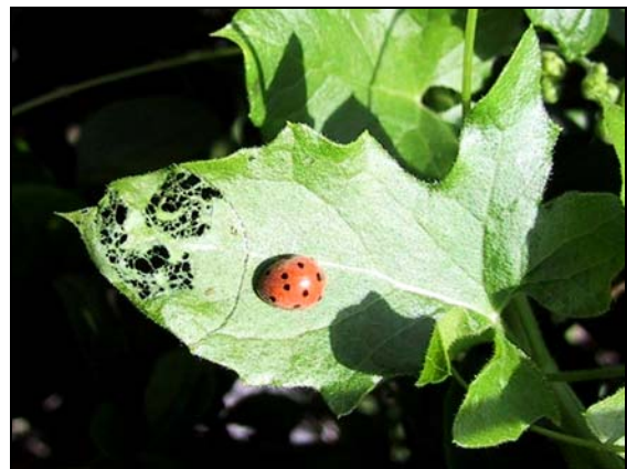
Feuille consommée : noter la découpe en arc de cercle autour de la partie attaquée